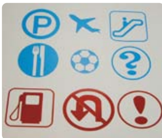
Hinweise in Folie