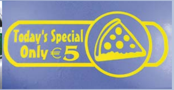
WERBUNG und vieles mehr...